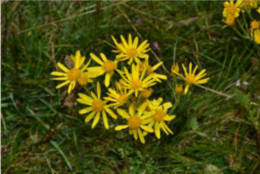
Jacobaea vulgaris Gaertn. subsp. gotlandica (Neuman) B. Nord.