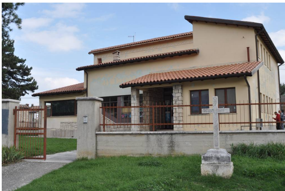
Comando CTA CFS esterno - Acquisanta Terme, loc. Paggese

Ministero dell'Ambiente della Tutela del Territorio e del Mare