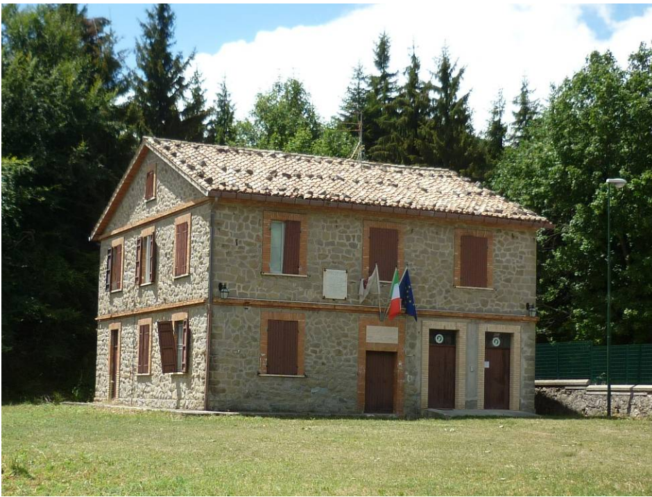
Rifugio del Ceppo

Ministero dell'Ambiente della Tutela del Territorio e del Mare