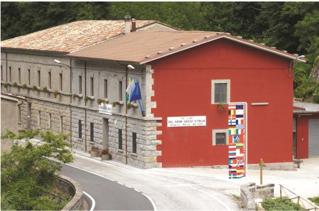
La Locanda del Cervo

Ministero dell'Ambiente della Tutela del Territorio e del Mare