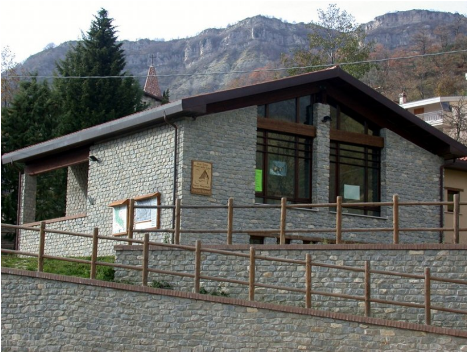
Punto Informativo Macchia da Sole

Ministero dell'Ambiente della Tutela del Territorio e del Mare