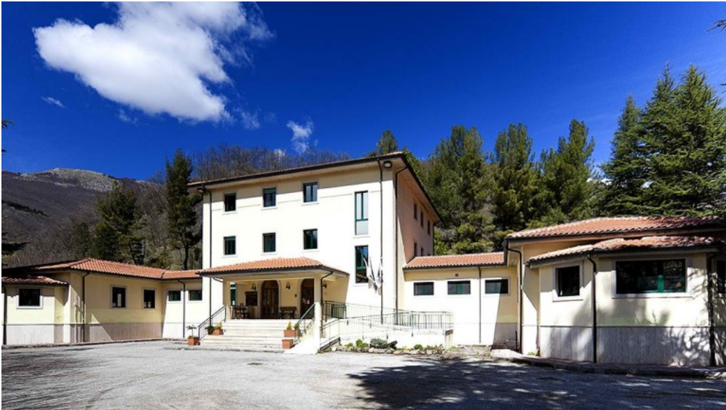
Centro dei due PArchi

Ministero dell'Ambiente della Tutela del Territorio e del Mare