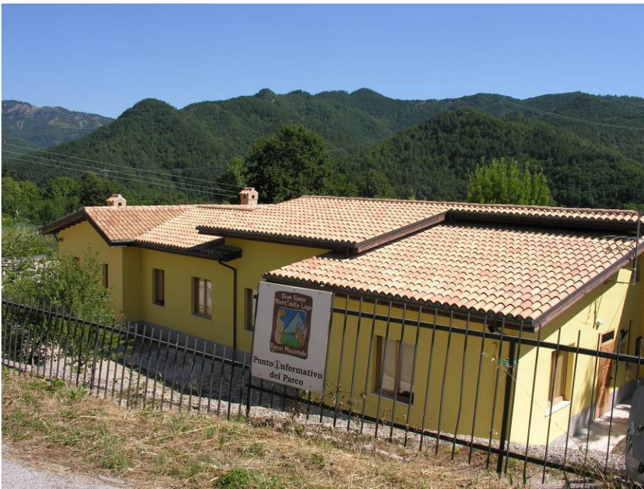
Nerito di Crognaleto (TE)

Ministero dell'Ambiente della Tutela del Territorio e del Mare