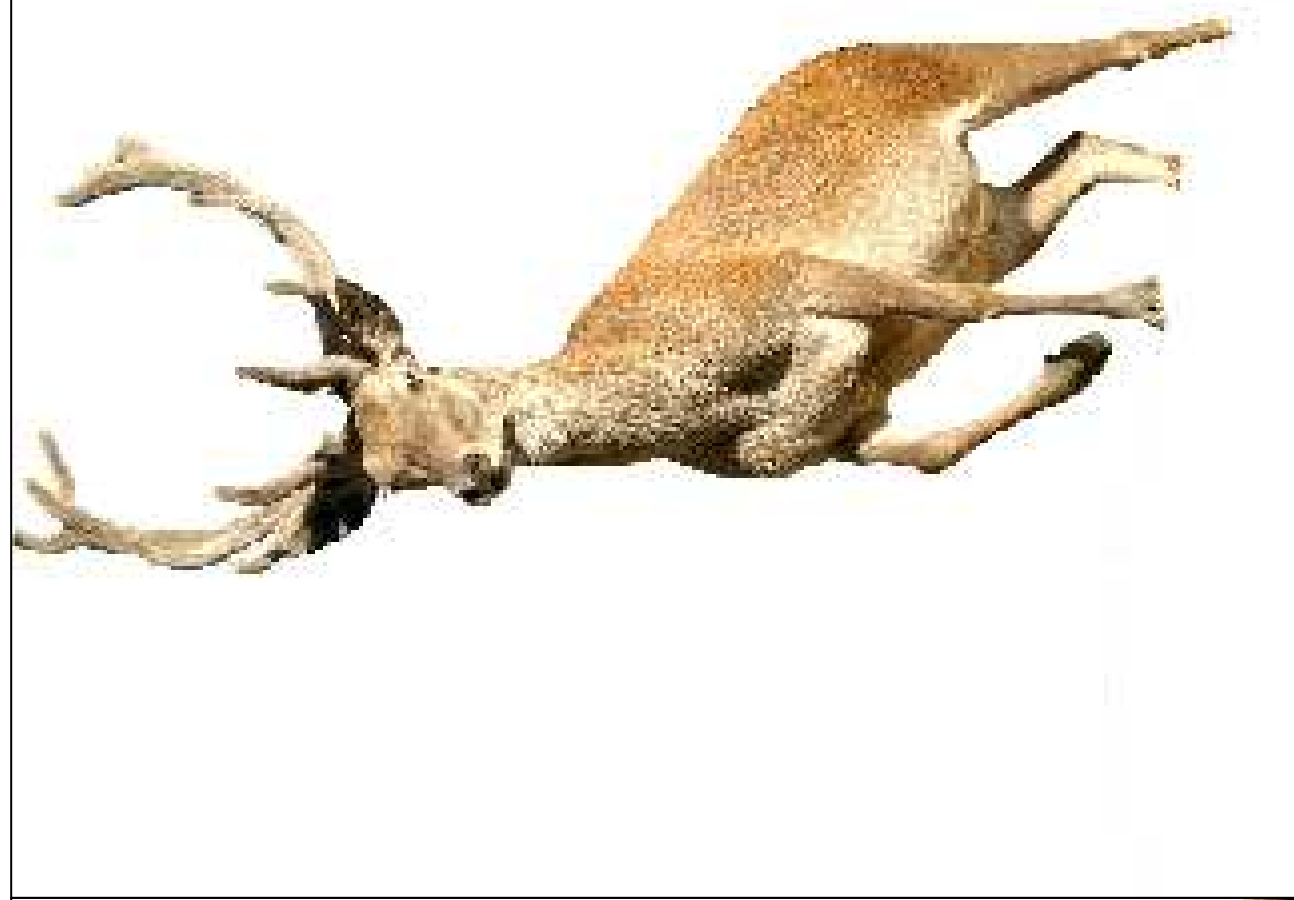
Sagoma scontornata spessore 10 cm. stampata su entrambi i lati